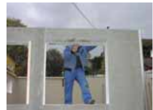
Ferdige dør- og vindusåpninger