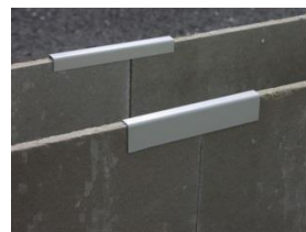
Platekantbeslag i skjøter