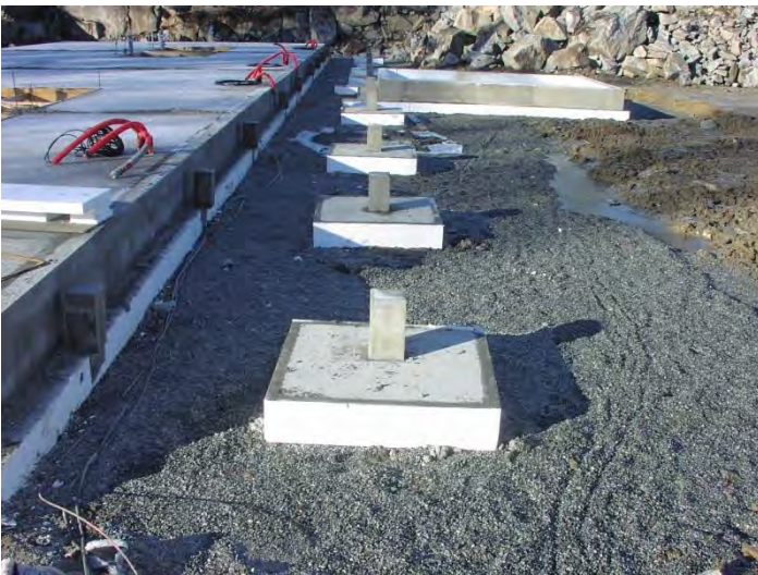
Søylefundament med søyleforskaling